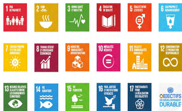
Objectifs de Développement Durable (ODD) 2015-30 de l'ONU

« dans le monde et de les résoudre pour, à terme, contribuer activement à la création d'un monde plus juste, pacifique, tolérant, intégrateur, sûr et durable. »