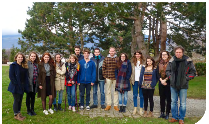
Option complémentaire de géographie 2015-16 – Classe 3OCGeo2 (Maître de classe : P. Gilliard)

Une liste plus complète des projets est disponible sur le site internet du développement durable du GYYV .