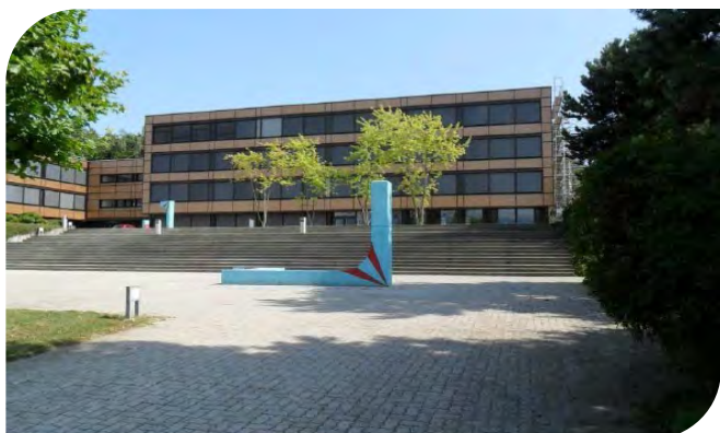
Façade nord du bâtiment B après rénovation.

Voici les projets qui contribuent à la création d'un laboratoire de la durabilité au Gymnase d'Yverdon.