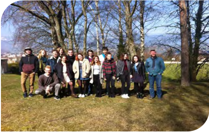
Option complémentaire de géographie 2015-16 – Classe 3OCGeo1 (Maître de classe : C. Henchoz)